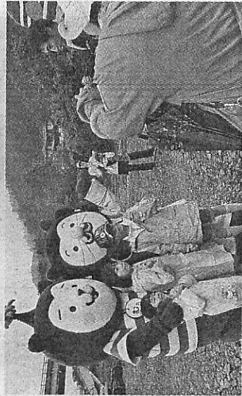
みやまき犬と写真撮影